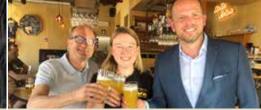
N-VA grootste partij in Hoegaarden op 26 mei (p. 3)