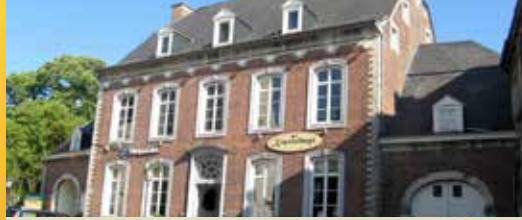
Grote uitverkoop in Hoegaarden (p. 2)