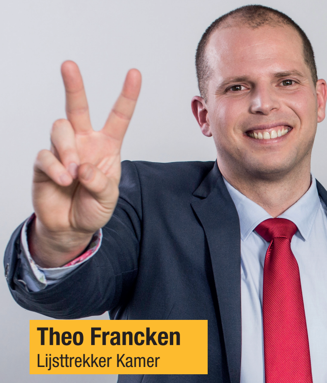
Theo Francken Lijsttrekker Kamer