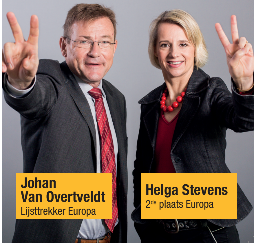
Johan Van Overtveldt Lijsttrekker Europa

De N-VA wil dat de verschillende landen van de EU hun identiteit kunnen bewaren. De EU moet niet over alles beslissen. Een Verenigde Staten van Europa, een Europese superstaat, is dus géén goed idee. De Unie moet groeien van onderuit en mag niet van bovenaf worden opgelegd.