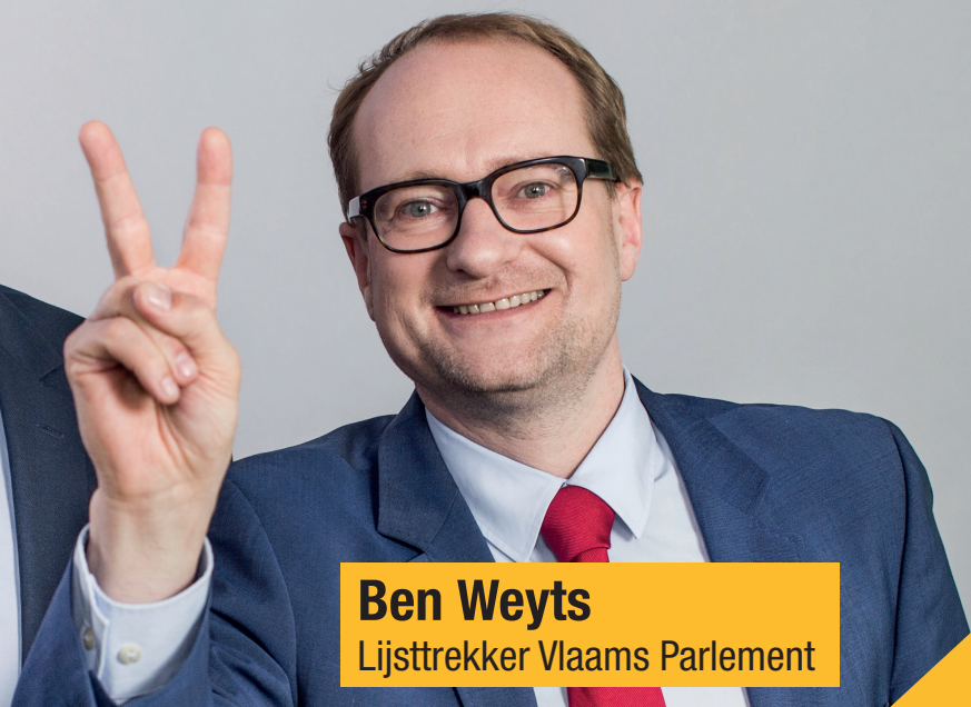
Ben Weyts Lijsttrekker Vlaams Parlement